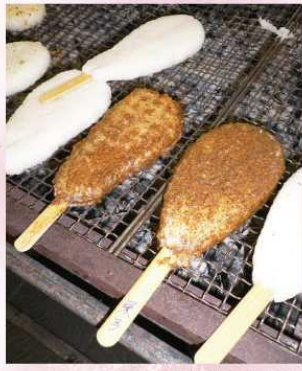
主催 | 新潟県三条市役所

3/13 (金) ~ 3/14 (土) 11:00~19:00 / 10:00~17:00