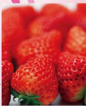
主催 | 新潟市