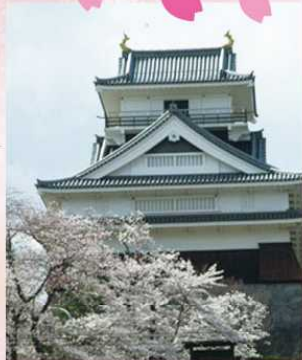
主催 | かみの山の観光と物産展実行委員会

3/15 (日) ~ 3/16 (月) 11:00~18:00 / 10:00~18:00